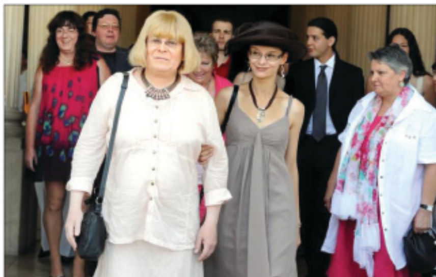
■ Le couple a salué, lors d'une conférence de presse, la position courageuse des élus de la ville et du département en faveur des droits des minorités.